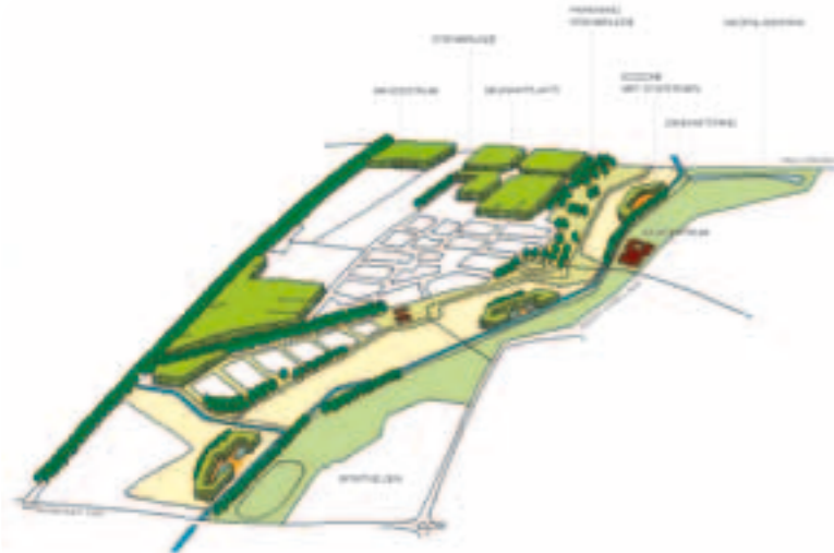
De drie zones van het Zandweteringpark: Parkrand Steenbrugge, Ecologische zone en Wezenlandpark