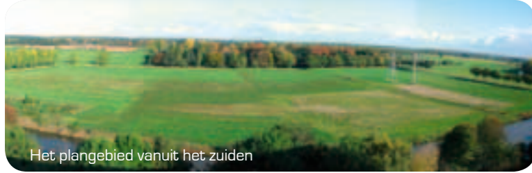
Het plangebied vanuit het zuiden