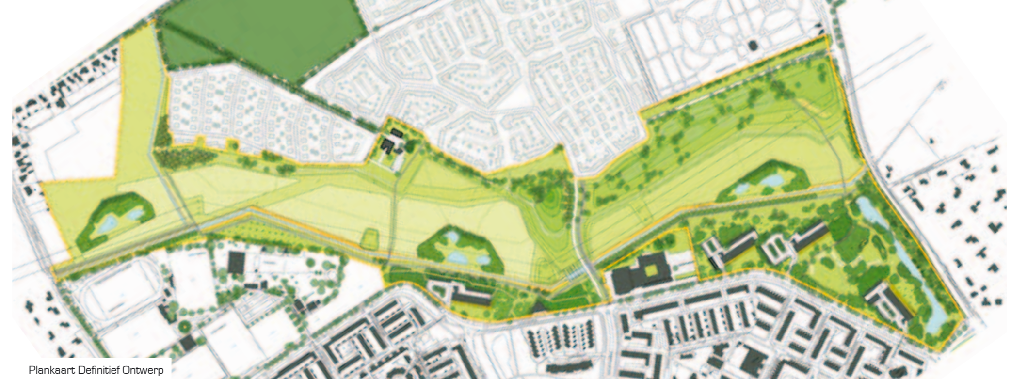
Plankaart Definitief Ontwerp

De accentverschillen in de drie zones vormen een mooie basis voor toekomstige contrasten in het park: contrasten in natuurbeelden, contrasten in beheer en contrasten in het gebruik. Aan de andere kant zullen de drie zones ook een eenheid moeten vormen. Een belangrijke rol is weggelegd voor het netwerk van wandel- en fietspaden, de zichtlijnen tussen de verschillende zones en de relaties van de parkinrichting met de ondergrond.