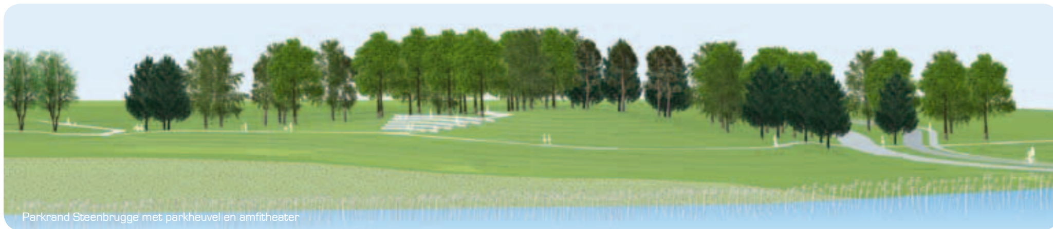
Parkrand Steenbrugge met parkheuvel en amfitheater